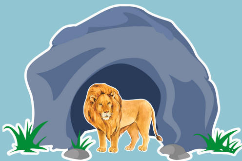
COVA DOS LEÕES